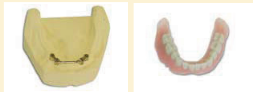
het vastzittend deel: de implantaten

implantaten ter sprake komen. Het ondergebit zit vaak te los omdat uw kaak ver geslonken is. Vaak is er dan geen hoogte meer aanwezig om het kunstgebit op vast te houden. Wanneer u ermee instemt om in de onderkaak implantaten te laten plaatsen, verwijst de tandprotheticus u schriftelijk naar de implantoloog met wie hij samenwerkt.